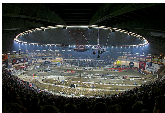
La fantastica atmosfera di Genova

L'evento ha richiamato una folla di circa 10.000 fans nel suo appuntamento finale di Genova. Grazie alla grande popolarità di questi eventi indoor si sta valutando, per la stagione 2008-2009, l'ipotesi di una Coppa del Mondo composta da 5 o 6 appuntamenti.